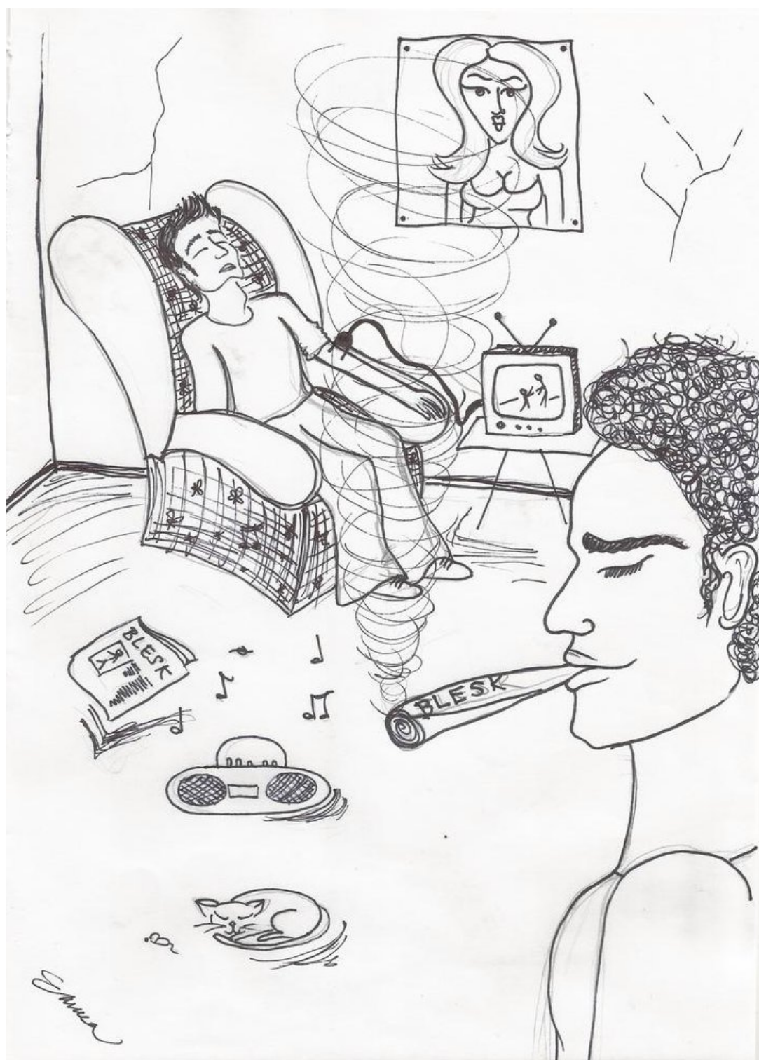
Nebojím se srovnání s narkotiky. I média mohou totiž krom svého negativního dopadu být návyková.